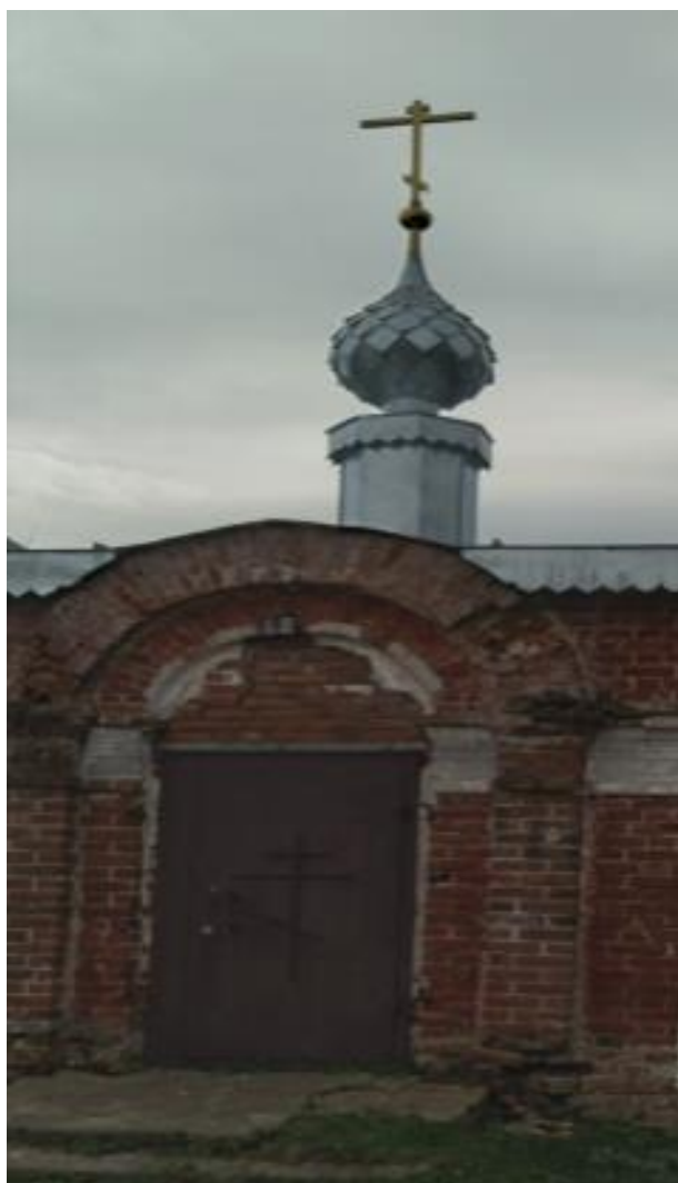
Часовня постройки конца 19-го начала 20-го веков.