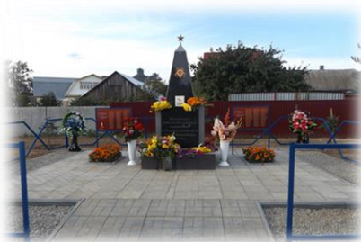
Памятник Погибшим воинам деревни Стрельниково.